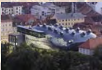
Graz. La città dei contrasti.

A richiesta si possono programmare escursioni personalizzate nella regione.